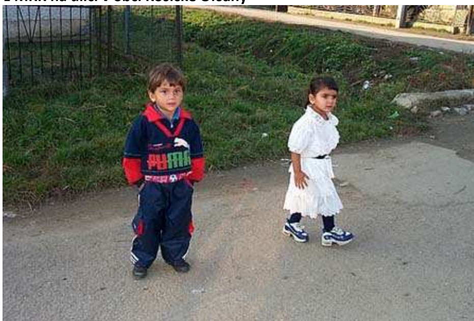
Foto: Deti z MRK na ulici v obci Košické Olšany